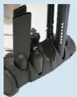
Trolley mit Zubehör Halter (nur SV315Z)